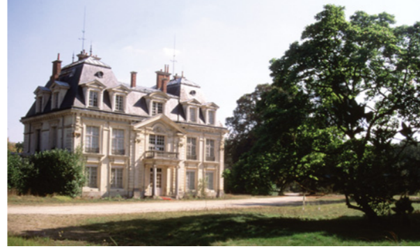
Le "Pavillon Royal"