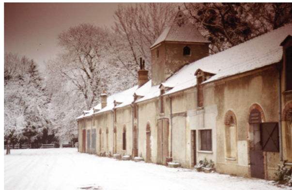
Ecuries du château de Nandy

5 Avant de quitter Nandy, sur les rives d'un autre étang se découvrent, depuis 1983, les oeuvres de Pierre Desvaux.