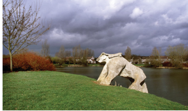
Oeuvre de Pierre Desvaux

1 Peu après le départ de la gare de Cesson, ouverte en 1855, un peuplier remarquable révèle le parcours du ru de Coulevrain. 2 Pour réduire les afflux d'eaux pluviales