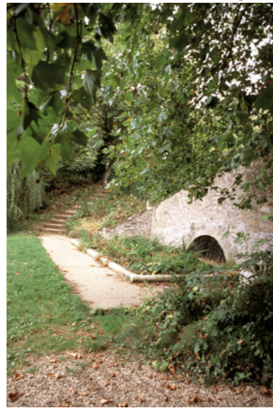
Le lavoir de la source Saint-Sulpice

8 Celle de Saint Sulpice, dans le domaine de Croix Fontaine se jetait par un souterrain dans un lavoir avant de rejoindre la Seine. De cet endroit, on apprécie la vue sur la grande courbe que fait le fleuve à sa sortie du département de Seine-et-Marne. En ce lieu, la femme du Général Letellier à la suite d'un accident de voiture en 1818, succomba à ses blessures; quelques jours plus tard, ne pouvant