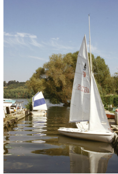
Ecole de voile de Seine-Port

8 Celle de Saint Sulpice, dans le domaine de Croix Fontaine se jetait par un souterrain dans un lavoir avant de rejoindre la Seine. De cet endroit, on apprécie la vue sur la grande courbe que fait le fleuve à sa sortie du département de Seine-et-Marne. En ce lieu, la femme du Général Letellier à la suite d'un accident de voiture en 1818, succomba à ses blessures; quelques jours plus tard, ne pouvant