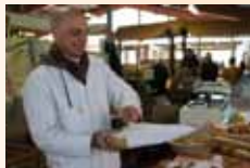
Boulangerie CALAIS Dimanche