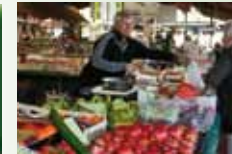
Fruits et Légumes BILLING Dimanche