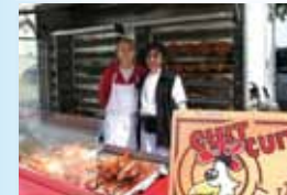
Rôtisserie CUIT CUIT Dimanche