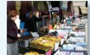
Vêtements PLE Jeudi