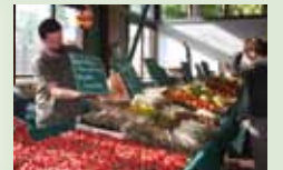
Fruits 4 Saisons CREAC'H Dimanche