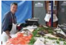
Poissonnerie J. XIMENES Dimanche et Jeudi