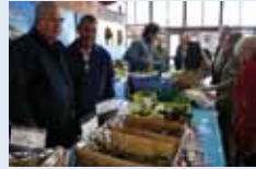
Fruits de Mer RENOUX Dimanche de Septembre à Avril