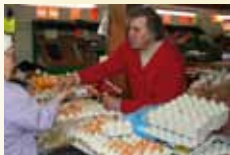
Œufs de la ferme LANDELLE Dimanche