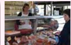
Charcuterie LANGLOIS Dimanche et Jeudi