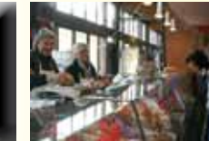
Volailles DEMANGE Dimanche et Jeudi