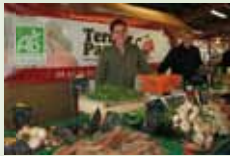
Produits Bio MENZEL Dimanche