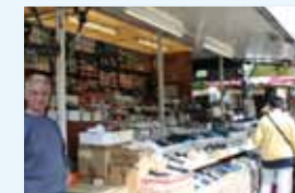
Chaussures PINOT Dimanche