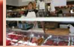
Boucherie Chevaline PICHON Dimanche et Jeudi