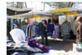
Vêtements MARIE Dimanche et Jeudi