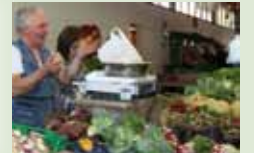
Fruits et Légumes CHAVEZ Dimanche