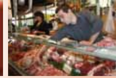
Boucherie FABRY Dimanche et Jeudi