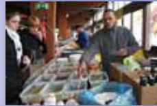
Produits Exotiques BENZIANE Dimanche et Jeudi