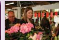
Fleuriste GENIN Dimanche