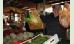
Fruits et Légumes MARNIA Dimanche et Jeudi