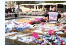
Mercerie RENNER Jeudi