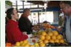
Fruits et Légumes GRISEZ Dimanche et Jeudi