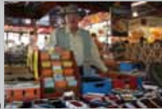
Cuir DERET Dimanche et Jeudi