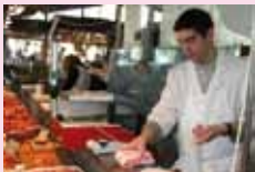
Triperie FLORES CONDE Dimanche et Jeudi