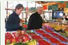
Fruits et Légumes GROSCHÈNE Dimanche et Jeudi