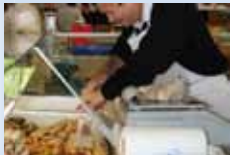
Produits chinois BOUPHAVICHITI Dimanche