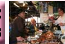
Charcuterie MOREL Dimanche et Jeudi