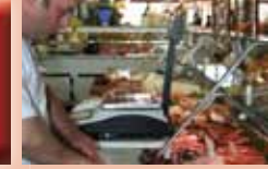
Boucherie FAURE Dimanche et Jeudi