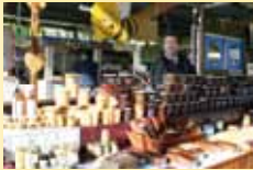
Apiculture LACLERGERIE Dimanche tous les 15 jours