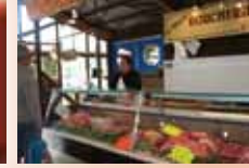
Boucherie-Charcuterie MARCHAND Dimanche et Jeudi