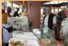
Produits antillais KAMARA Dimanche