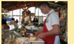
Crèmerie JOSÉ Dimanche et Jeudi