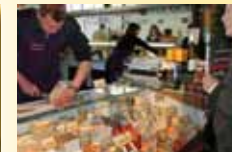
Crèmerie VANHOVE Dimanche et Jeudi